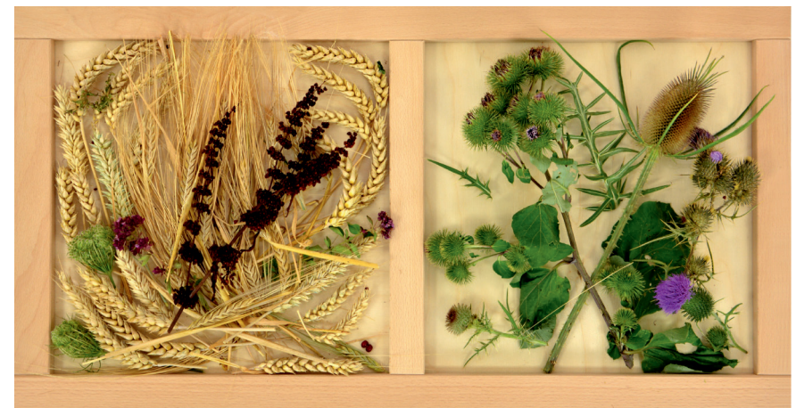
Der Natur auf der Spur: Wandherbarium