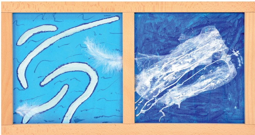
Die vier Elemente: Collagentechnik